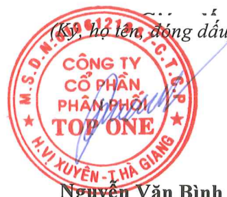
Nguyễn Văn Bình